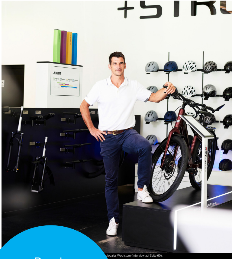
...globales Wachstum (Interview auf Seite 60).

Reach 213,000 readers with attractive combination discounts