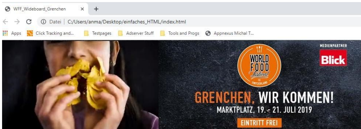
(Screen des Beispiel Banner)

Den Html Code mit den vorgenommenen Anpassungen im Browser öffnen. Bei einem Klick würde man nun auf eine Fehlerseite kommen (null)