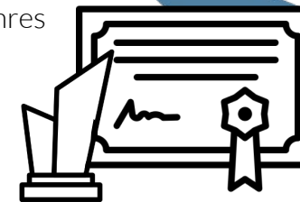
Namentliche Erwähnung Urkunde & Award