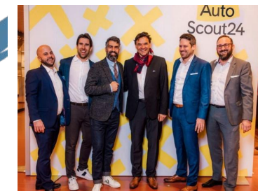
Präsenz vor Ort Event «The Car Show»