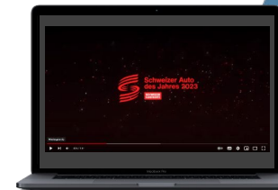
Video Opener / Closer Billboard Video Clip «Storytelling» Auto des Jahres