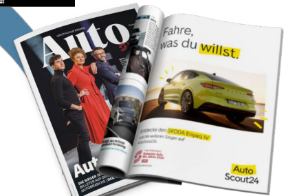
Gratulationsanzeige Heft-im-Heft «Auto»