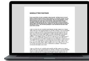
Newsletter Partner Versand