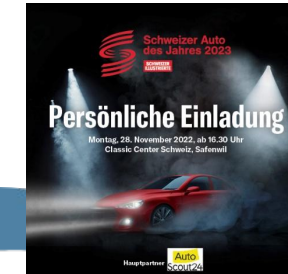
Logo Präsenz Event «The Car Show»