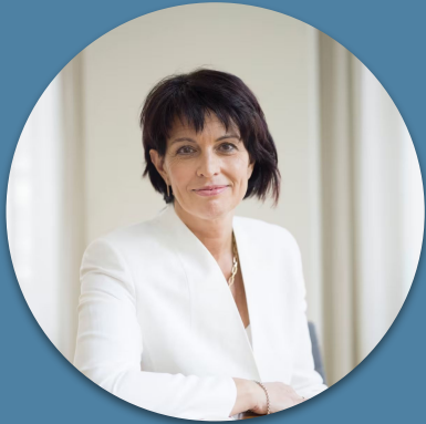
Doris Leuthard Alt-Bundesrätin