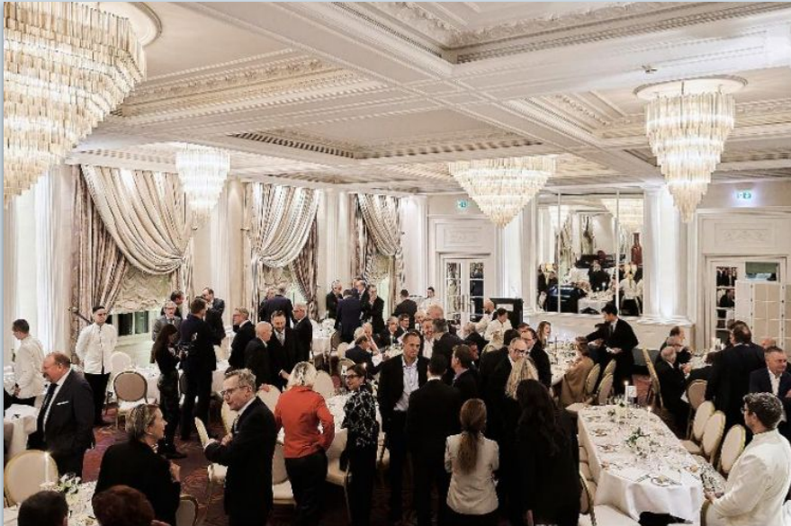
Gründungsort der «Hall of Fame der Schweizer Wirtschaft»: das Petit Palais im «Baur au Lac» in Zürich.

Die Auswahl der Preisträger erfolgt durch eine sorgfältig ausgewählte fünfköpfige Jury, bestehend aus hochkarätigen Experten und Führungskräften aus verschiedenen Bereichen der Wirtschaft.