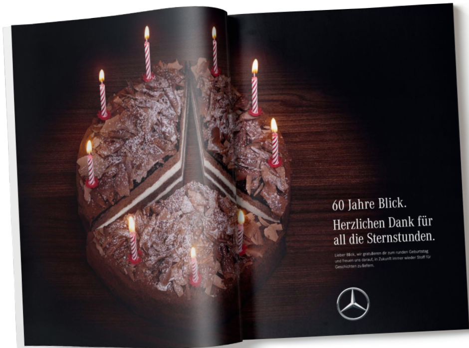
Annonce de félicitations