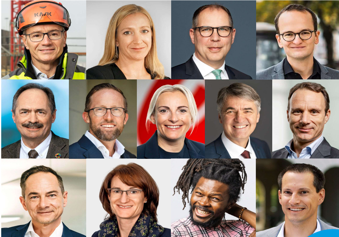
Die Nachhaltigen: Wir sind nicht abergläubisch. In diesem Special kommen dreizehn Macherinnen und Macher zu Wort, die täglich für mehr Nachhaltigkeit in der Schweiz arbeiten.