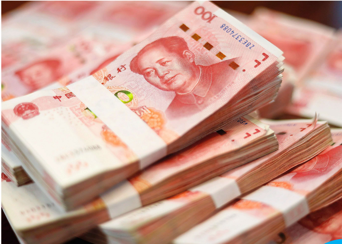
Geopolitik: Eine detaillierte Analyse und Bewertung nationaler und internationaler politischer Entwicklungen hilft bei der Risikoeinschätzung im Hinblick auf die Folgen für die Unternehmenslandschaft.