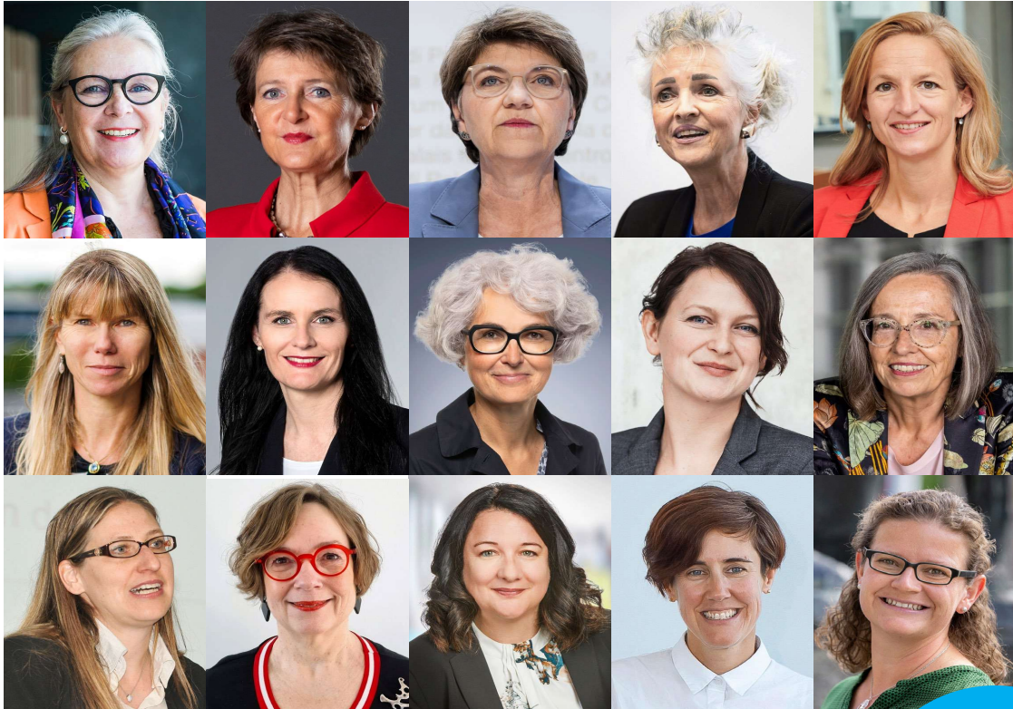
Zukunftsfähig: Diese Frauen beschleunigen die Transformation der Schweizer Wirtschaft hin zu mehr Nachhaltigkeit.

Exklusiv Wie Bundesrätin Viola Amherd das VBS auf Nachhaltigkeit drillt. Seite 31